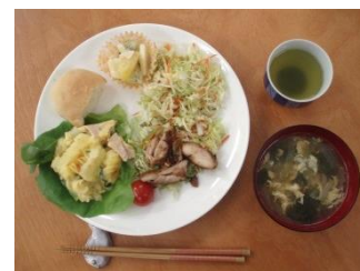
クリスマスランチ 楽しく頂きました

「この色のほうがいいわね」「子どもっぽいかしら」細かい手仕事ですが、みなさん熱心です。先生のご指導もあり素敵なクリスマスカードができました。