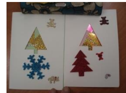
クリスマスカード

「この色のほうがいいわね」「子どもっぽいかしら」細かい手仕事ですが、みなさん熱心です。先生のご指導もあり素敵なクリスマスカードができました。