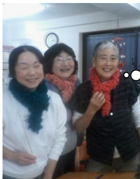
11月16日 マフラー編みました 1時間で完成!