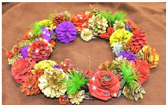
12月4日クリスマスリース、お見事！