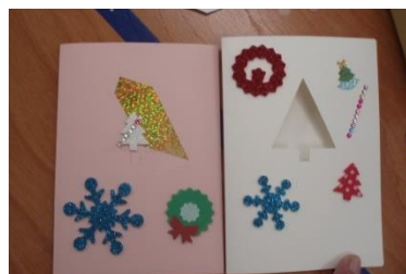
12月14日 クリスマスカード作成

これからの予定 1月 新春を祝う 3月 郷土の森散策 と サントリービール 見学